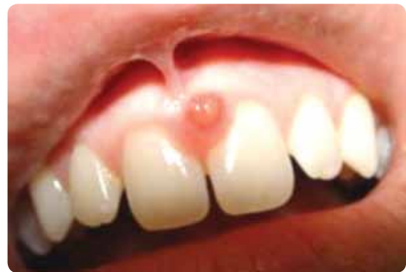
Figura 1 - Aspecto clínico da lesão nodular entre os incisivos centrais superiores.

Paciente leucoderma, do género feminino, com 19 anos de idade, compareceu ao consultório de um estomatologista, com a queixa de lesão nodular com aproximadamente 0,8 cm no seu maior diâmetro com evolução de seis meses, segundo o relato da paciente, apresentando coloração vermelho intenso entre os incisivos superiores, em região de papila