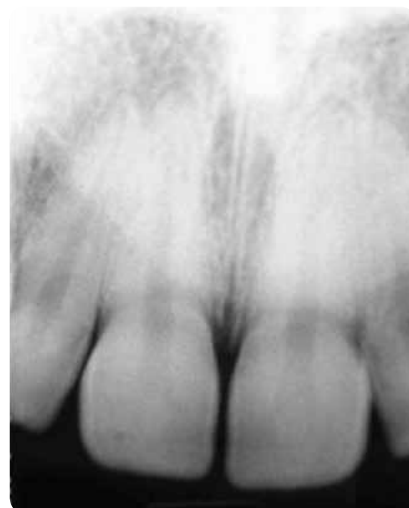
Figura 3 - Radiografia periapical pós-operatória dos incisivos centrais superiores mostrando nenhuma alteração óssea ou dentária após a excisão da lesão. interdentária, indolor e que não apresentava hemorragia à palpação (Figura 1). Após minucioso exame clínico foi feito exame radiográfico periapical da região para auxiliar no diag-