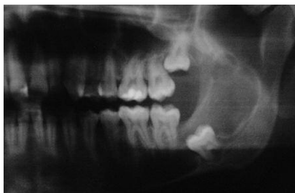
Figura 2 - Detalhe da radiografia panorâmica inicial. Notar extensão da lesão desde a incisura da mandíbula ao primeiro molar inferior esquerdo

fradura da mandíbula até ao corpo, na região de primeiro molar inferior. A lesão apresentava contornos nítidos e halo radiopaco discreto em todo o seu perímetro. O terceiro molar (dente 38), totalmente incluso e méso-angulado, estava completamente imerso na lesão e próximo à basal da mandíbula. Os ápices de primeiro e segundo molares apresentavam íntima relação com a lesão (Figura 2).