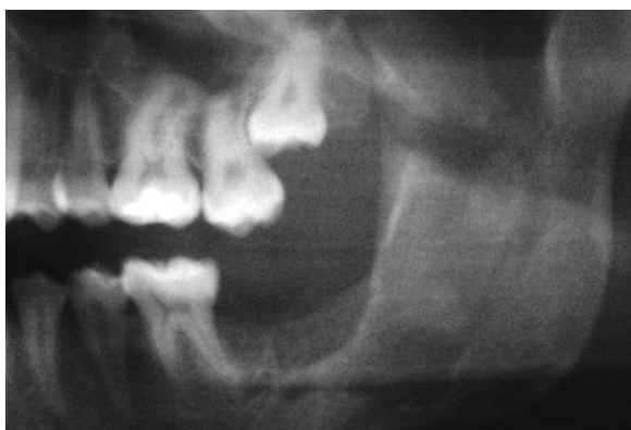
Figura 7 - Detalhe de radiografia panorâmica, sete meses após exérese da lesão

Procedeu-se a uma incisão desde a região retromolar seguindo por intrassulcular vestibular dos dentes até ao 35 e terminando com uma descarga oblíqua na região do segundo pré-molar. Após o descolamento do retalho, foi realizada osteotomia com instrumentos rotatórios de alta rotação sob irrigação com soro fisiológico 0,9% e remoção de parte da tábua óssea vestibular. Com elevadores foi feita exérese dos terceiro e segundo molares inferiores (dentes 37 e 38). A lesão removida foi enviada para exame laboratorial. Após vigorosa curetagem, utilizaram-se brocas de baixa rotação, montadas em peça de mão, para realização da brocagem (peeling) das paredes ósseas remanescentes (Figura 6). Finalmente, após protecção das mucosas com compressas, uma gaze embebida em solução de Carnoy foi colocada na cavidade e lá deixada por exactos três minutos. Após esse período a mesma foi retirada e irrigação profusa por igual período foi feita. O retalho foi suturado e o paciente foi dispensado com receita de antibiótico, antiinflamatório e analgésico no