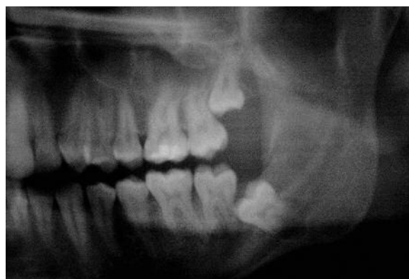
Figura 5 - Detalhe da radiografia panorâmica, um ano e meio após instalação do dreno