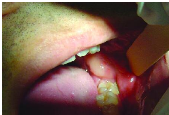
Figura 4 - Trajeto fistuloso após remoção do dreno