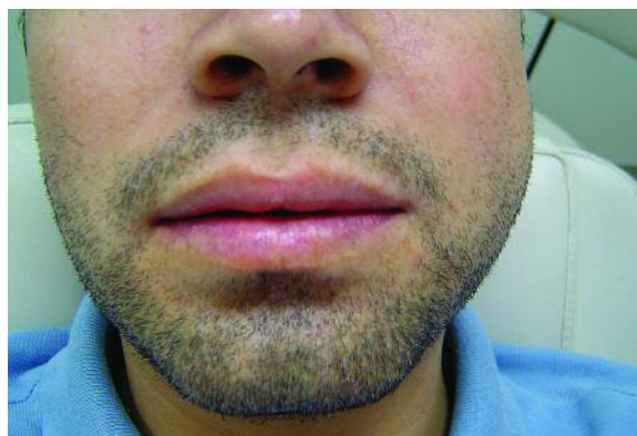
Figura 1 - Edema importante no lado esquerdo da face

Ao exame radiográfico foi observada extensa área radiolúcida no lado esquerdo de mandíbula, que se estendia da chan-