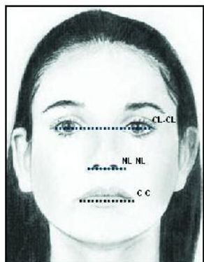
Figura 2 - Análise fotográfica facial transversal

Na análise fotográfica facial transversal (Figura 2) foi verificada a relação de proporcionalidade entre os segmentos: CL-CL//NL-NL; NL-NL//C-C (Tabela 2).