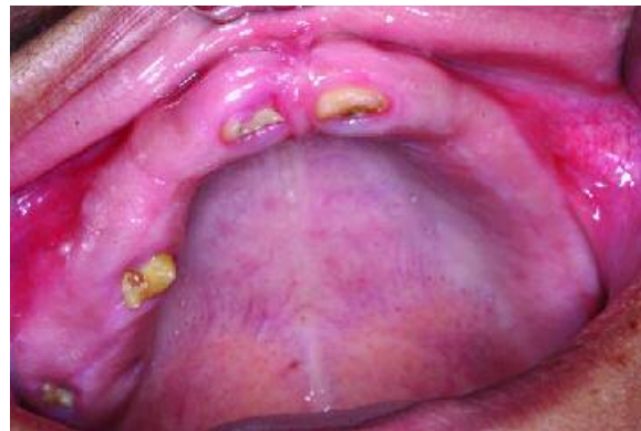
Figura 1 - Imagem da arcada superior mostrando as unidades dentárias presentes (17, 14, 11 e 21) que se apresentam mal-formadas, com coloração amarelada e coroas pequenas

da, não tomou nenhuma medicação ou esteve com alguma doença relevante. Entretanto, afirmou que seu irmão de 11 anos de idade tinha as mesmas características e queixa. Em seguida, foi feito o exame físico tendo-se verificado a presença das unidades dentárias 17, 14, 11, 21 e 31 na cavidade bucal sendo que estas se apresentavam mal-formadas, com coloração amarelada e coroas pequenas (Figuras 1 e 2). Verificou-se também, a presença de fistula intra-oral na região da unidade dentária 17 bem como um aumento gengival não inflamatório no rebordo ântero-inferior.