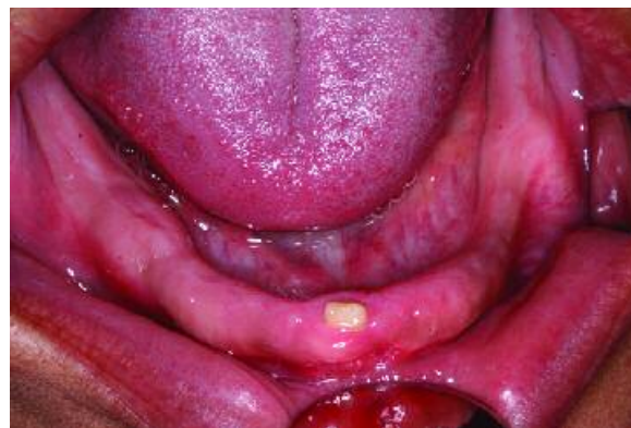
Figura 2 - Imagem da arcada inferior mostrando a unidade dentária 31 mal-formada, com coloração amarelada e coroa pequena.

Após análise de exame radiográfico panorâmico, verificou-se a presença de dentes fantasmas em todas as hemiarquadas sendo que as unidades dentárias 18, 16, 15, 13, 12, 22, 23, 24, 25, 27, 28, 38, 37, 36, 35, 34, 33, 32, 41, 42, 43, 45, 46, 47 e 48 estavam inclusas. Os "dentes fantasmas" apresentavam foramens apicais abertos, discreta demarcação entre esmalte e dentina e baixa densidade mineral adquirindo um aspecto radiolúcido (Figura 3). Diante dos dados obtidos na anamnese, exame físico e radiográfico foi diagnosticado à paciente uma odontodisplasia regional.