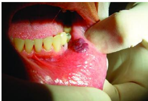
Figura 1 - Hemangioma de lábio inferior

No acompanhamento de 2 e 7 dias, a ferida cirúrgica apresentava-se coberta por uma rede de colagénio de coloração amarelada, a qual protege a ferida e garante uma cicatrização com mínima contração dos tecidos (Figuras 3 e 4).