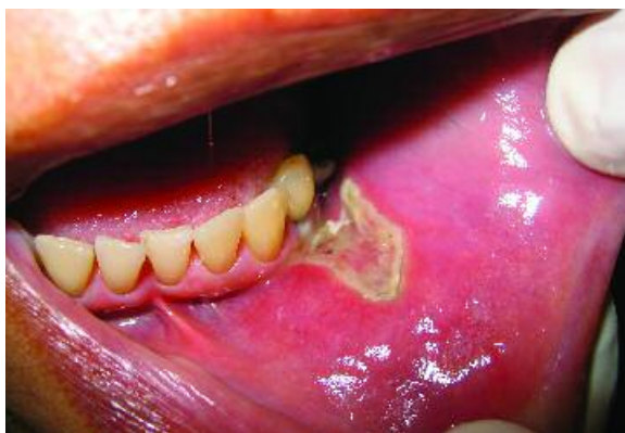
Figura 4 - Sete dias de pós-operatório