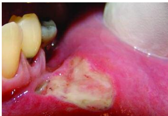
Figura 3 - Dois dias de pós-operatório