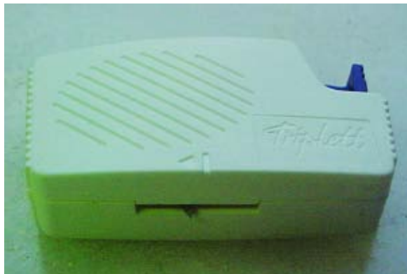
Figura 1 - Dispositivo descartável automatizado para realização do tempo de sangramento (Tripplet®) Bleeding Time Test Device, Helena Laboratories - E.U.A.

O programa utilizado foi o MINITAB Statistical Software ®, versão 14.1,2003 Minitab Inc. Pennsylvania - E.U.A.