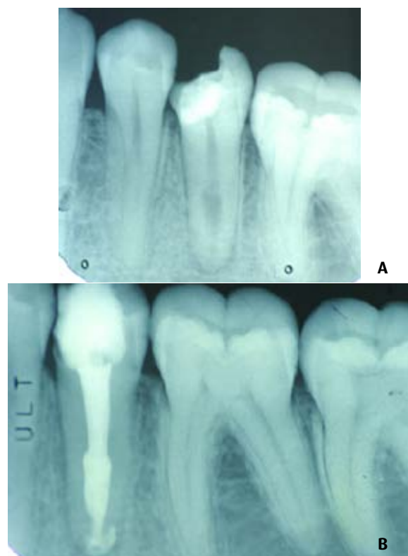
Figura 2A - Dente pré-molar inferior, com reabsorção radicular interna, localizada a nível do 1/3 apical.

Neste tipo de reabsorção, o processo inicia-se no interior do canal, não atingindo a superfície externa da raiz. Desta forma, se a obturação é realizada pela técnica de condensação lateral, ela deve ser feita em três etapas distintas: a primeira consiste na obturação da porção apical do canal, cortando depois a guta ao nível da reabsorção; na segunda, coloca-se cimento na zona da reabsorção com um lântulo ou uma lima K; na última procede-se ao preenchimento da reabsorção e do resto do canal com guta-percha (17) . No entanto, como as técnicas termoplásticas de injeção de guta quente ou a compactação vertical, facilitam o procedimento da obturação, nestes casos devem ser estas as técnicas a utilizar com primeira escolha (12,17) (Figura 2).