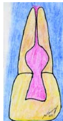
Figura 1 - Representação esquemática da reabsorção interna. Canal em forma de balão.

Já em 1976 Gartner AM e col., (10) descreveram as "linhas de guia" para ajudar a diferenciar a reabsorção interna da externa, atribuindo as seguintes características às reabsorções internas (Figura 1): as margens da lesão são lisas e bem definidas; a posição no canal geralmente é simétrica, mas pode ser assimétrica; a radiotransparência é de densidade uniforme; as paredes do sistema de canais podem apresentar-se em forma de balão.