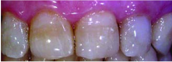
Figura 4 - Aspecto final da reabilitação do maxilar superior

Relativamente ao maxilar inferior, os dentes presentes evidenciavam significativa perda de tecido dentário (Figura 5).