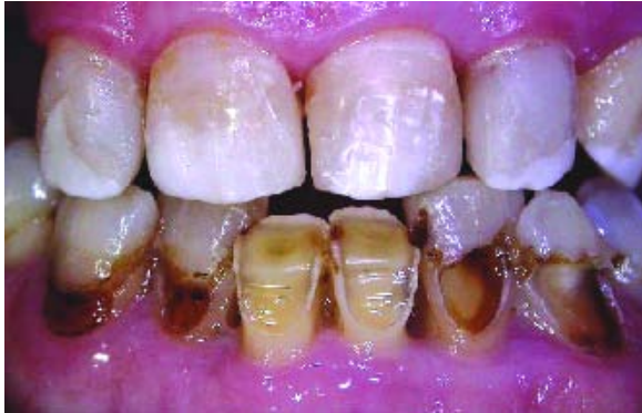
Figura 5 - Arcada inferior. Múltiplas lesões classe V

Relativamente ao maxilar inferior, os dentes presentes evidenciavam significativa perda de tecido dentário (Figura 5).