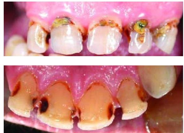
Figura 2 - Arcada superior. Vista vestibular e palatina

Iniciou-se a restauração dos dentes presentes na arcada superior, que apresentavam simultaneamente lesões dentárias classe V e classe III (mesial e distal) (Figura 2).