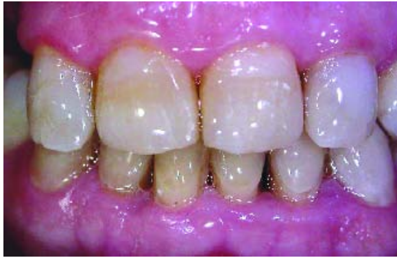
Figura 9 - Reabilitação estética concluída