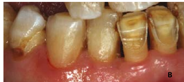
Figura 7 - Dentes 42, 43 e 44. (a) Estado inicial e (b) após restauração dos dentes 42 e 43.

Os dentes 31 e 41 apresentavam grande desgaste na face vestibular e a sua restauração consistiu na confecção de fa-cetas vestibulares de resina composta directamente nos dentes (Figura 8).