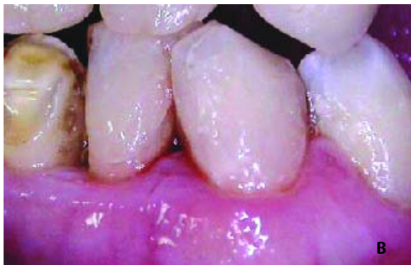
Figura 6 - Dentes 32, 33 e 34. (a) Estado inicial, e (b) após restauração