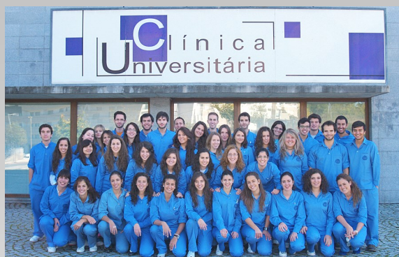
Alunos Finalistas de Medicina Dentária 2008\2013