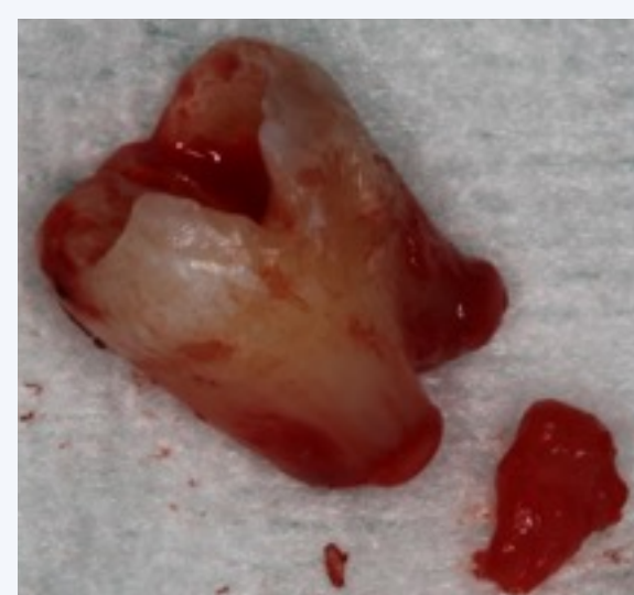
Dentes 48 extraído