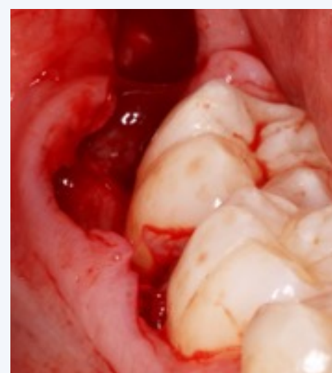
Incisão em baioneta