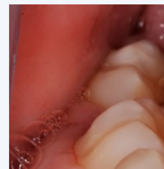
Pós-operatório aos 8 dias