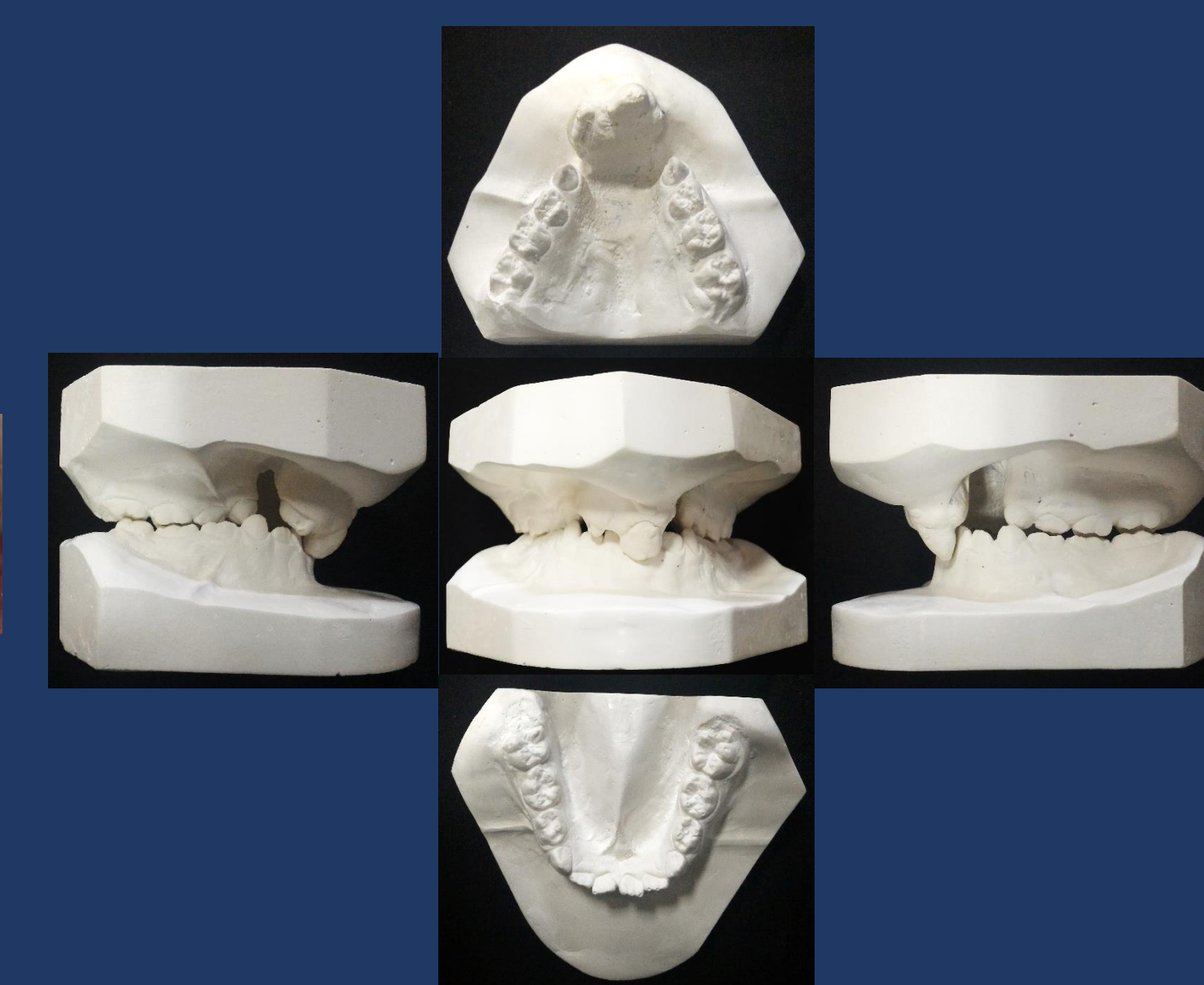
Figs. 13-17: Modelos de estudo