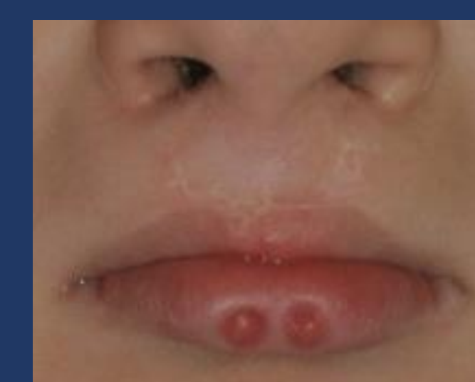
Fig. 7: Presença de duas depressões para-medianas no lábio inferior que excretam saliva