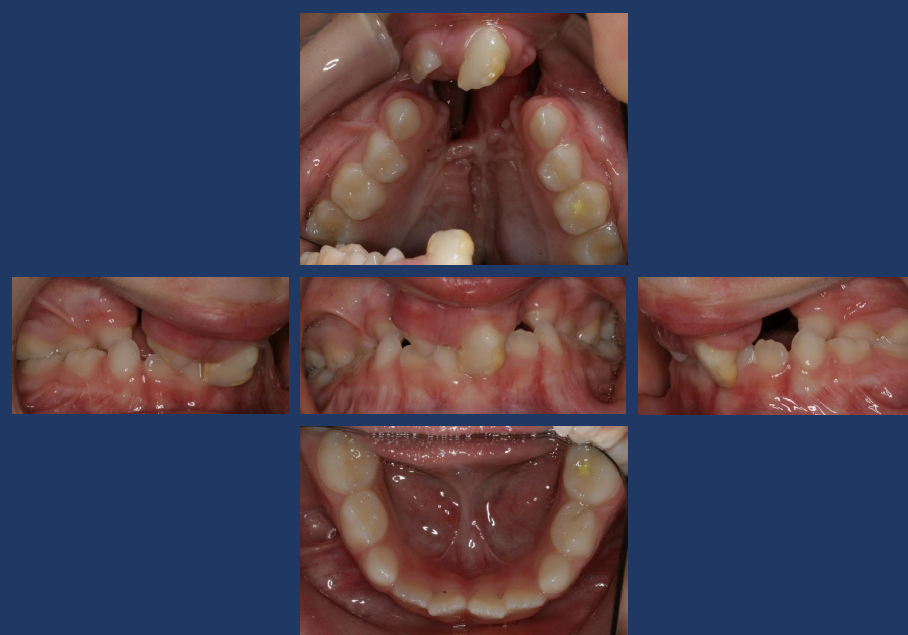
Figs. 8-12: Fotografias intra-orais