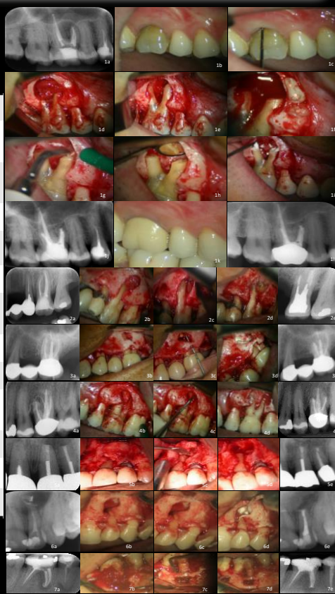
Figura 1- Caso 1 mais detalhado com imagens pre-operatórias (1a-c), intra-operatórias (1d-i) e pós operatórias (1j-l), e casos 2-7 documentados com radiografia pre-operatória, procedimentos clínicos e radiografia pós-operatória.

PTT – Tratamento endodôntico prévio, ASAP – Periodontite apical assintomática, SAP – Periodontite apical sintomática