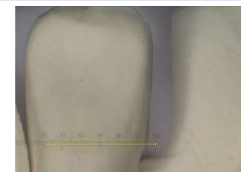
Figura 2- Calibração da medida com o software ImageJ.