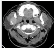
Figura 2 – Imagem TC axial da lesão do corpo mandibular direito com destruição das corticais ósseas externa e interna.