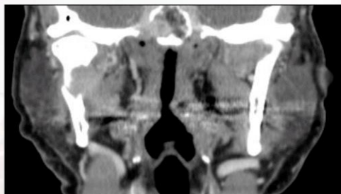
Figura 1 – TC corte coronal da lesão a condicionar fratura patológica do côndilo mandibular direito.

Foi observado novamente por ORL que excluiu desta vez patologia salivar e encaminhou para Estomatologia para avaliação de eventual patologia articular da ATM, pela presença de crepitações pré-auriculares direitas e limitação da abertura oral desde há uma semana.