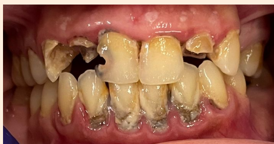
Fig 2 Observação intra oral inicial.