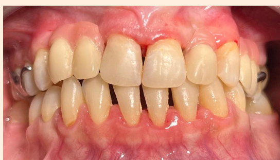
Fig 3 Observação intra oral final.