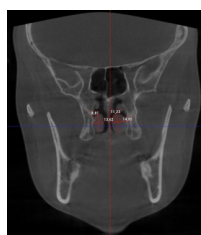
Figura 2. Altura e Largura do Corneto Nasal Inferior (ACNI) e (LCNI)