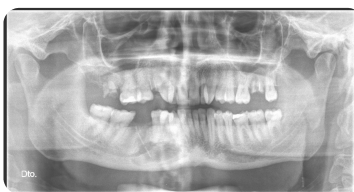
Fig2: OPG 1 mês antes da enucleação da lesão

Procedeu-se a quistectomia + colocação de xenoinxerto ósseo + encerramento com membrana de colagénio