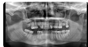
Fig3: OPG: 4 Meses após enucleação da lesão