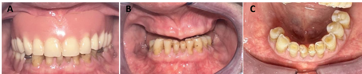
Figura 2. (A) Fotografia intra-oral com próteses removíveis (B), fotografia intra-oral sem prótese, (C) pormenor do desgaste dentário dos dentes remanescente.