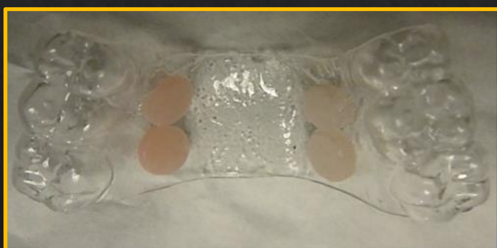
Figura 1. Dispositivo intraoral com as amostras de resina a testar: polimetilmetacrilato (à esquerda) e poliamida (à direita).

Foram preparadas 30 amostras de tamanhos iguais de PMMA e de PA. Duas amostras de cada resina foram coladas na superfície externa de um dispositivo intraoral tipo goteira (Fig. 1) e ficaram expostas durante 4 horas à cavidade oral de 15 participantes. A adesão microbiana à superfície dos materiais de microrganismos totais aeróbios e anaeróbios, Streptococcus do grupo Mutans e de fungos foi avaliada pela técnica de quantificação em placa utilizando meios de cultura ricos e seletivos: agar Sangue, agar Mitis salivarius com 0,2 unidades de bacitracina/mL e 20% de sacarose, Brain Heart Infusion e agar Sabouraud com cloranfenicol. Na análise estatística utilizaram-se os testes t de Student e o qui-quadrado .