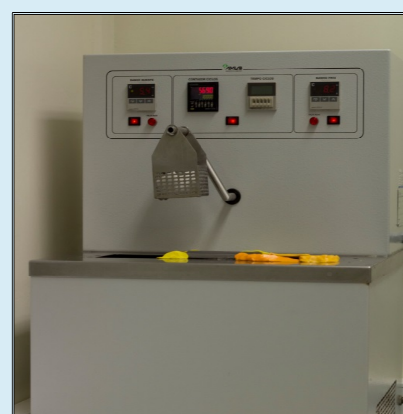
Figura 6 - Termociclador (Aralab – Rio de Mouro, Portugal)