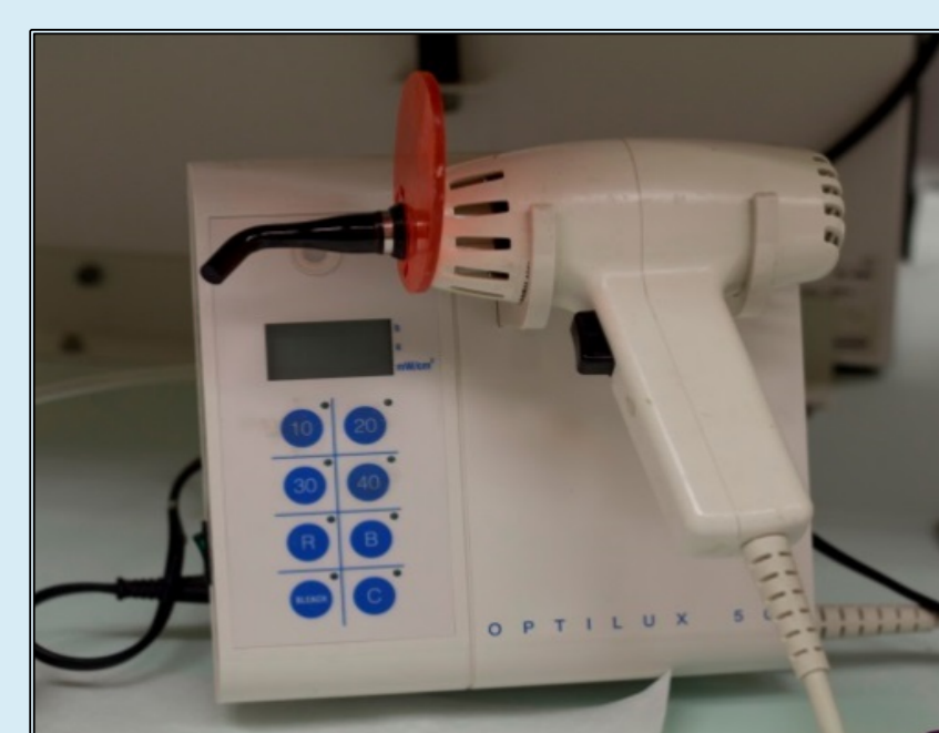
Figura 4 - Fotopolimerizador Optilux 501 (SDS Kerr – Orange, EUA)