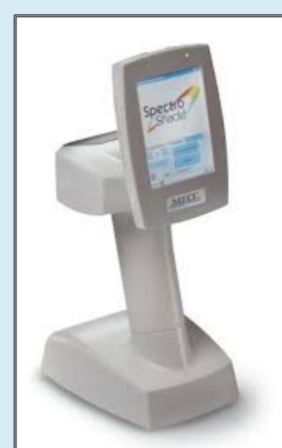
Figura 5 - Espectrofotómetro (Spectro Shade™ Micro – MHT Optic Research, Niederhasli, Suíça)