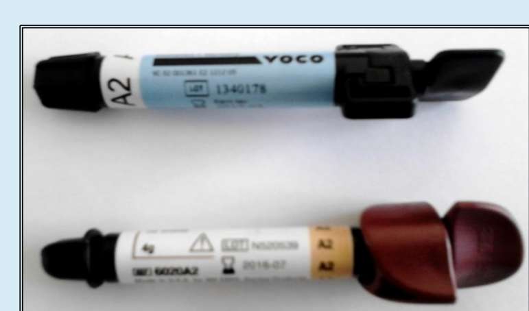
Figura 1 - Resina composta Polofil® Supra e resina composta Filtek™ Z250

Os dados obtidos foram analisados estatisticamente, através do teste t-Student a um nível de significância de 5%.