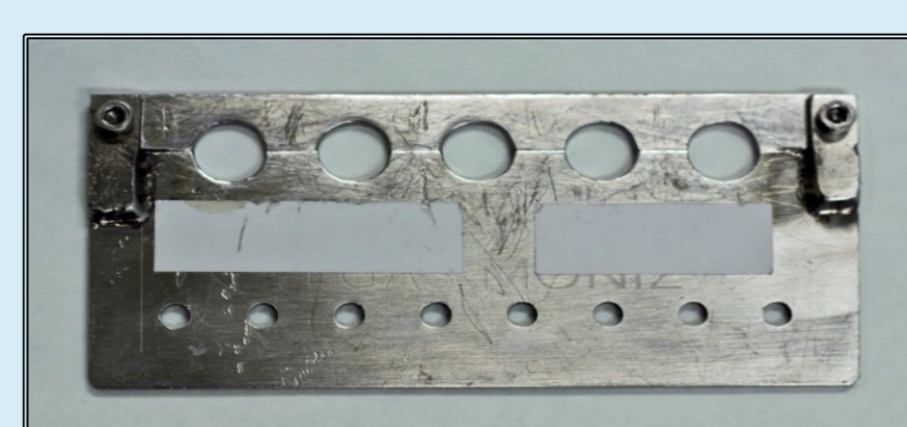
Figura 2 - Molde de aço inoxidável (ISCSEM)