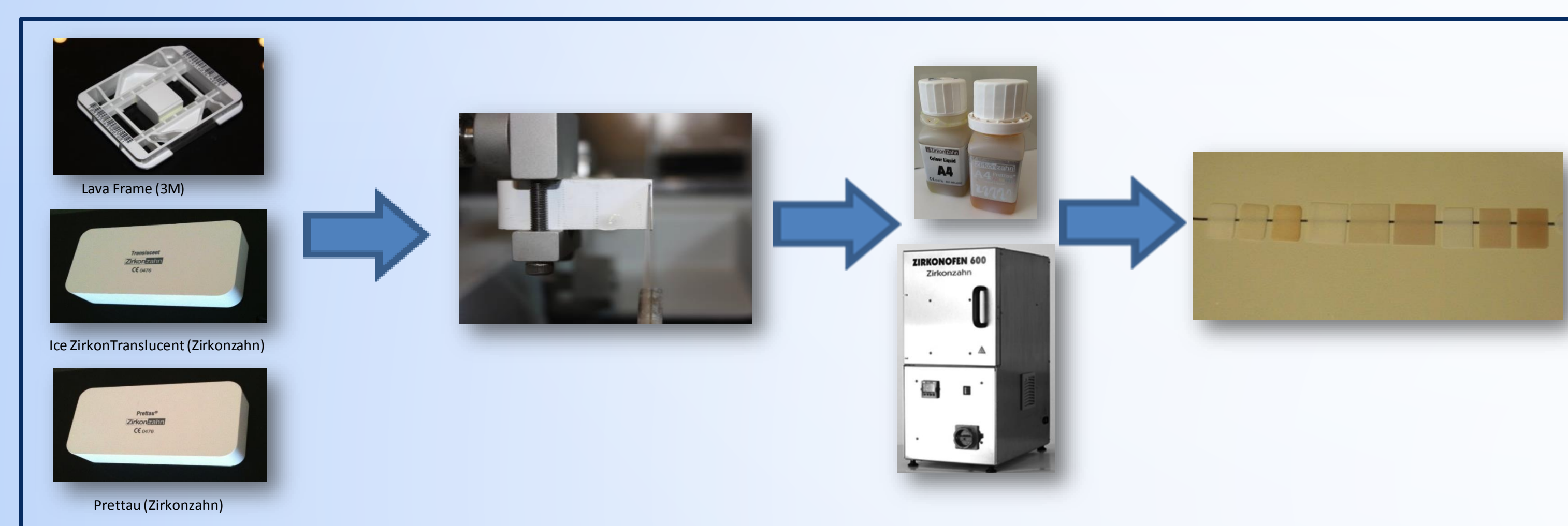
Figura 1 - Obtenção dos espécimes

Após a sinterização, os espécimes foram limpos em banho de ultrassons (Elmasonic One; Elma) com álcool (96%, 5 minutos), secos com jato de ar e fixados a placas de alumínio com cola de cianoacrilato. De seguida, foram metalizados com liga ouro em condições de vácuo durante 80 segundos (JFC-1100, JEOL Ltd., Tóquio, Japão) e observados em microscopia eletrónica de varrimento (JSM-7001F, JEOL Ltd., Tóquio, Japão) com ampliação entre 200 e 10000 vezes. Para cada espécime, foi obtido o espectro de emissão de raios X e determinada a análise elementar através da sonda EDS (Figura 2). A determinação do tamanho médio do grão foi realizado segundo o método da intercepção linear de acordo com ASTM Standard E112-96, utilizando o software Matlab – Mathworks, versão 7.0 (Natick, Massachusetts, EUA). Para cada espécime de cerâmica foram contabilizadas o número de grãos intercetados com 8 linhas traçadas de comprimento definido usando uma imagem com ampliação 10000x (Figura 3).