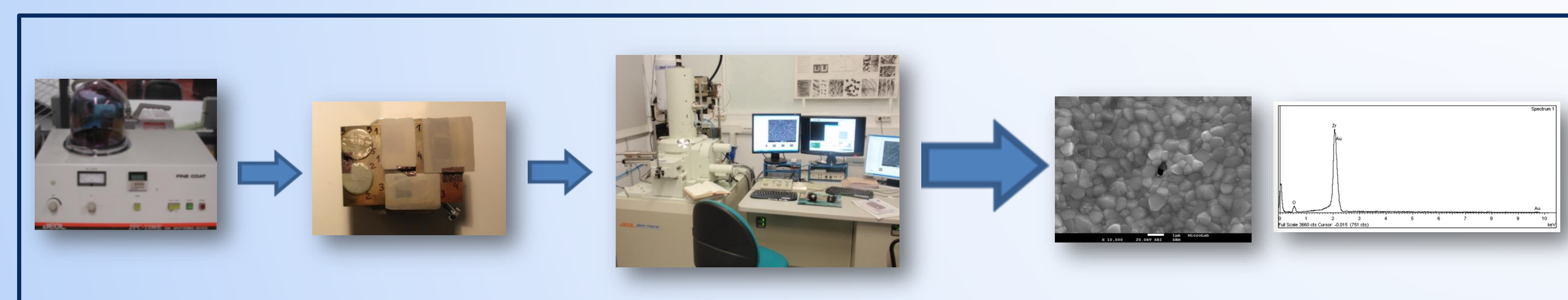
Figura 2 – Avaliação com SEM-EDS.