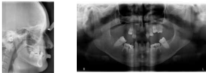
Registos radiográficos pré-cirúrgicos (15 anos)