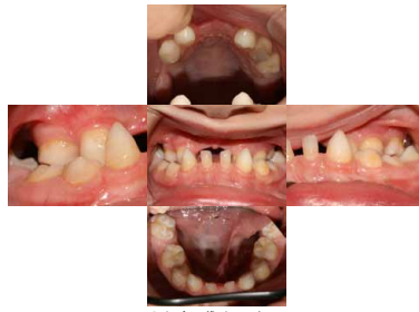
Registo fotográfico intra-oral