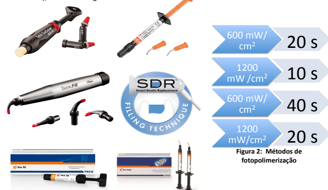
Figura 2: Métodos de fotopolimerização

A profundidade de polimerização dos compósitos foi determinada através do método recomendado pela ISO 4049 e pela determinação do rácio de microdureza. As resinas compostas utilizadas foram: Tetric EvoCeram Bulk Fill (Ivoclar Vivadent), x-tra base (Voco), x-tra fill (Voco), Filtek Bulk Fill (3M ESPE), SonicFill (Kerr), SDR (Dentsply) (fig. 1). Para cada uma destas resinas compostas, foram criados 4 grupos experimentais, consoante o método de polimerização utilizado (600mW/cm 2 durante 20 s; 1200mW/cm 2 durante 10 s; 600mW/cm 2 durante 40 s; 1200mW/cm 2 durante 20 s), conforme a figura 2.