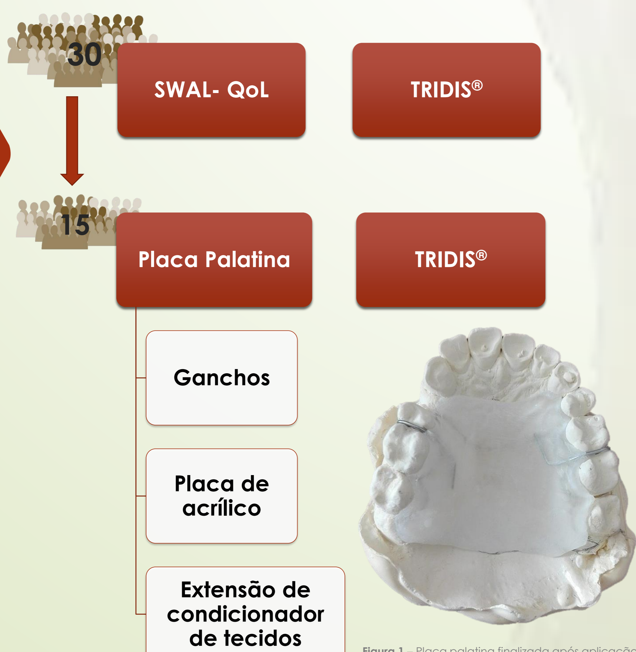
Esquema 1 – Diagrama representativo do protocolo utilizado aquando do estudo, nas duas fases.