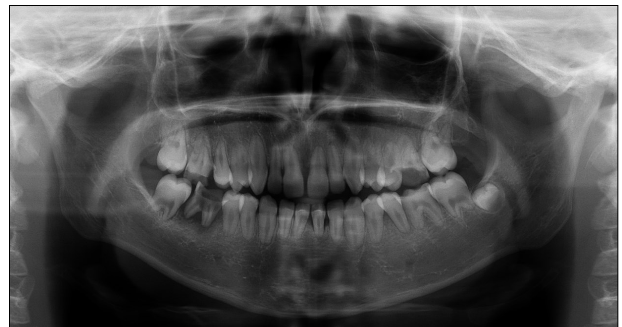
Fig. 4- Ortopantomografia com sinais de reabsorção radicular.