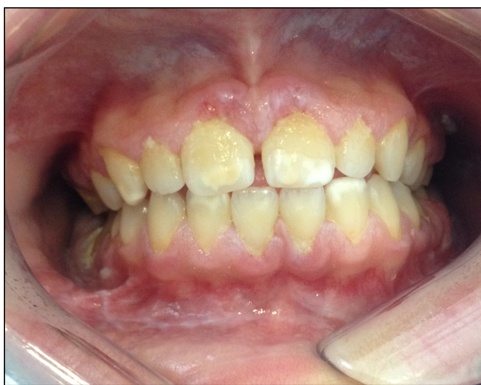
Fig. 2- Gengivite, lesão branca da mucosa vestibular, hipoplasia do esmalte.