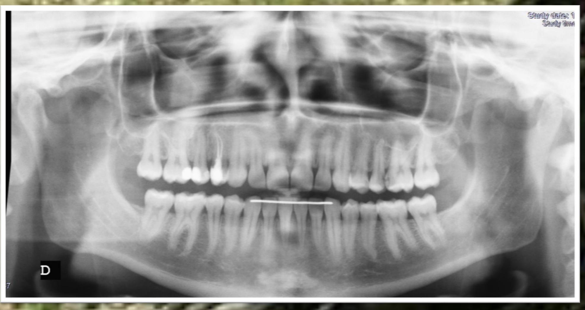
Militar inicialmente em classe 1 passou a 3.

Após observação clínica, 223 indivíduos, 74,33%, foram considerados aptos, dos quais 136 como Classe 1 e 87 como Classe 2. Na classe 3 encontravam-se 20,33% da amostra, com 61 elementos e por fim, os restantes 16 (5,33%) foram classificados como indeterminados ou inaptos. A observação da ortopantomografia provocou alteração da classificação de 53 militares inicialmente considerados aptos, (17,66%), baixando à classe III, agora com 113 indivíduos (38%), enquanto que 1 desta última foi considerado inapto. Foram identificados achados radiográficos em 98 exames, 32,66%, com particular incidência nas lesões periapicais (10%), dentes inclusos (11%) ou impactados (7%), anomalias dentárias (7%), pericoronarite (6,66%), reabsorção óssea (6,33%), reabsorção radicular (5%), agnesias (2%), supranumerários (1%).