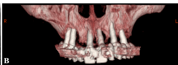
Figura 1 – Situação clínica inicial - radiografia panorâmica (A) e tomografia computadorizada (B).