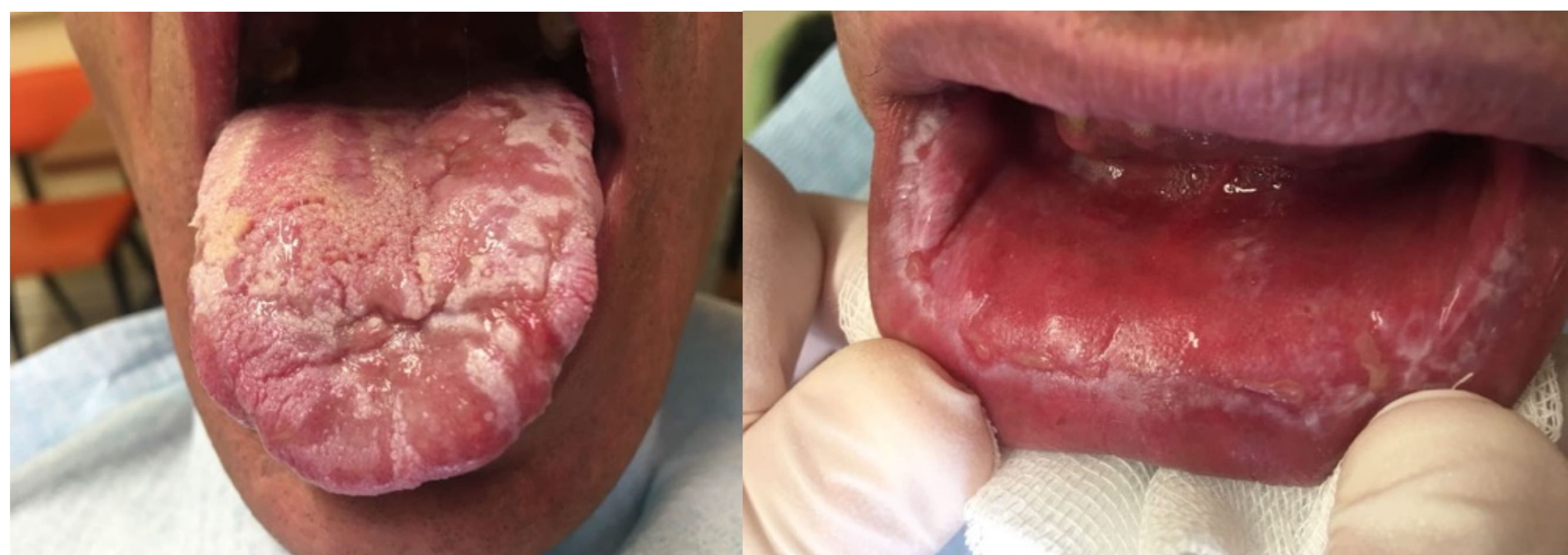
Fig.1- LPO erosivo (Julho de 2018)

D.L.C, sexo masculino, 43 anos, com antecedentes de gastrite H.Pylori +, fumador 20UMA, encaminhado para Consulta Externa de Estomatologia em 2016 por leucoplasia da cavidade oral, dispersa, com grande atingimento lingual, com 3 anos de evolução. Doente referia dor intensa que melhorava com o consumo de alimentos frios, ardência bucal, sensação de edema da língua e hemorragias frequentes aquando da higienização oral. Medicado pelo MGF com fluconazol oral e nistatina tópica sem melhoria. Ao Exame Objectivo apresentava lesões leucoplásicas dispersas por toda a língua e face vestibular do lábio inferior, com áreas de ulceração e cicatrização. Em Abril de 2017, realizou biópsias incisionais das lesões da cavidade oral cujo resultado histológico foi compatível com LP Erosivo. Medicado inicialmente com prednisolona tópica com boa resposta sintomática. Em Julho de 2018 por exacerbação do quadro clínico foi medicado com Lepicortinolo oral SOS, Betametasona tópica em SOS, Omeprazol SOS, e Nimesulida SOS, encontrando-se actualmente assintomático e com as lesões estáveis.