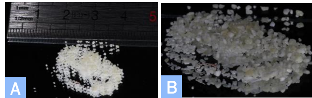
Figura 2 (A) e (B): Fotografias macroscópicas do particulado dentinário do incisivo central superior íntegro humano, obtido pelo dispositivo Smart Dentin Grinder™.

Para a realização deste estudo foram utilizados dois dentes incisivos centrais superiores humanos, um deles íntegro, isto é, sem qualquer material artificial adicionado, e o outro contendo uma restauração com resina composta. Os dentes foram processados com a Smart Dentin Grinder™ (IDS Integrated Dental Systems) (Figura 1) segundo o protocolo do fabricante. Para este processamento dentário foi considerada uma trituração de 3 segundos, seguida de uma fase de vibração de 20 segundos, para que fossem obtidas partículas entre os 300 e 1200 µm (Figura2). A análise da morfologia do particulado dentinário obtido foi efetuada por microscopia eletrónica de varrimento (NanoSEM - FEI Nova 200 (FEG/SEM)). A composição química das amostras foi identificada através de EDX (EDAX - Pegasus X4M).