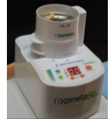
Figura 1: Smart Dentin Grinder™ (IDS Integrated Dental Systems)

Diversos biomateriais têm vindo a ser desenvolvidos com o intuito de promover a regeneração óssea, sendo que a possibilidade de utilização de dentes extraídos como um material de enxerto autólogo tem sido proposta. O dispositivo Smart Dentin Grinder™ (IDS Integrated Dental Systems) (Calvo-Guirado JL et al. , 2018- a) e (Calvo-Guirado JL et al. , 2018- b) ) foi concebido com este propósito, permitindo o fabrico do material de enxerto por trituração dentária. Contudo, previamente a este procedimento, um dos cuidados clínicos protocolados pressupõe a remoção prévia de qualquer material artificial da superfície dentária, como a resina composta. Como tal, este estudo teve como objetivo avaliar a existência de diferenças na topografia e composição química de particulados dentinários, obtidos após a moagem de dentes, para posterior utilização como material de enxerto, consoante a presença ou ausência de resina composta na sua superfície.