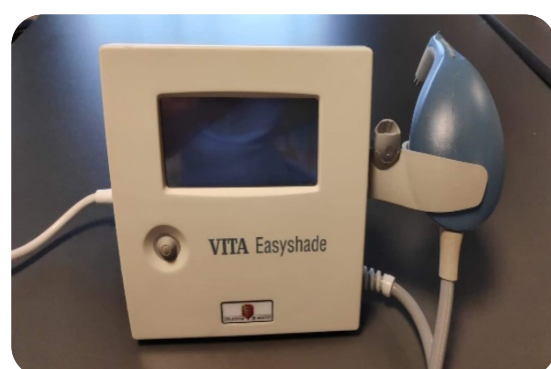
Figura 4: Espectrofotómetro VITA.

A microdureza do esmalte foi medida às 0 horas, 2 semanas, 1 mês e 2 meses, com um microdurómetro e uma ponta indentadora Vickers (Figura 3).