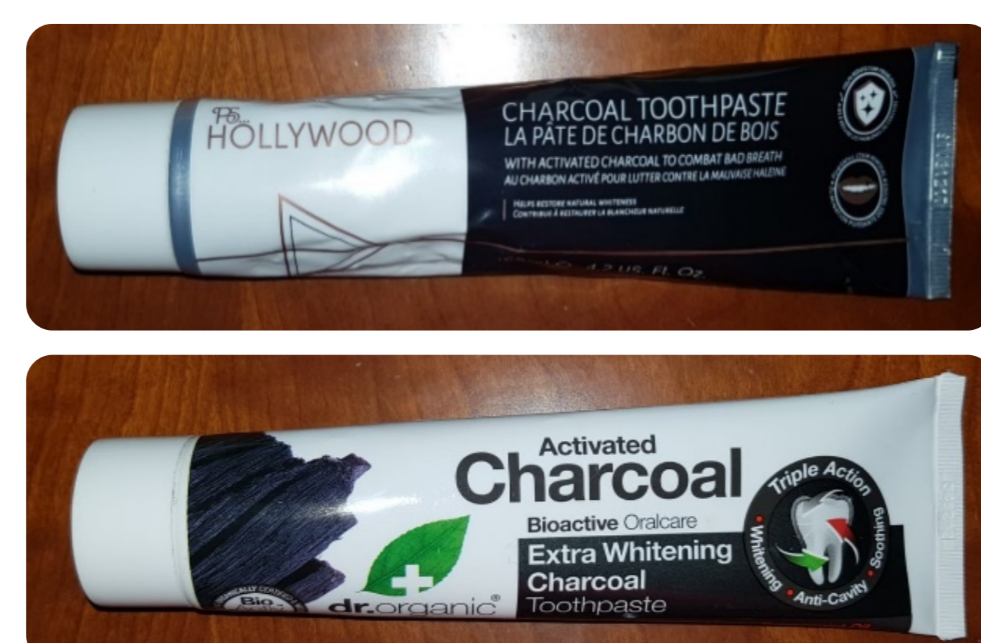
Figura 2: Pastas dentífricas com carvão ativado utilizadas no estudo.