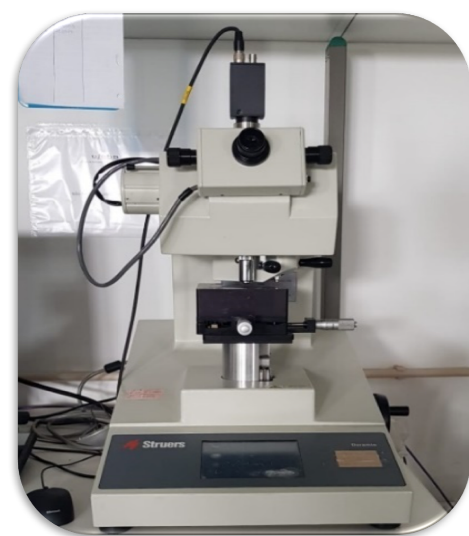
Figura 3: Microdurómetro Duramin.

A microdureza do esmalte foi medida às 0 horas, 2 semanas, 1 mês e 2 meses, com um microdurómetro e uma ponta indentadora Vickers (Figura 3).