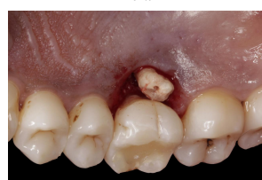
Fig. 6 – Secção da raiz palatina do 16