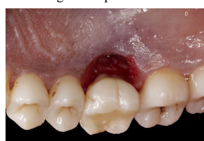
Fig. 8 – Dente 16 com raiz amputada