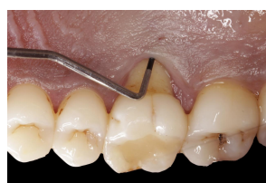
Fig. 3 – Profundidade de sondagem em palatino do 16