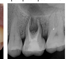
Fig. 10 Radiografia periapical de controlo após 45 dias