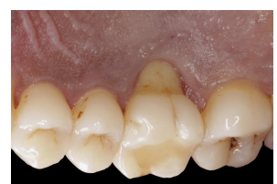
Fig. 2 – Face palatina do 16-inicial