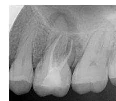
Fig. 5 – Radiografia periapical após TENC