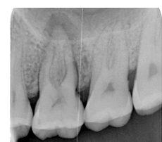
Fig. 4 – Radiografia periapical inicial