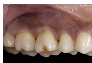
Fig. 1 – Face vestibular do 16-inicial

Paciente do género masculino com 29 anos de idade e com diagnóstico de periodontite foi reavaliado após realizar tratamento periodontal não cirúrgico completo. Aquando da reavaliação periodontal, o dente 16 (Fig.1 e 2) apresentava profundidade de sondagem superior a 9 milímetros na face palatina (Fig.3) e hemorragia à sondagem. O exame radiográfico intra-oral revelou que o dente apresentava um defeito ósseo circundante à raiz palatina, para além do ápice (Fig.4). Foi proposto ao paciente realizar o tratamento endodôntico não cirúrgico (TENC) das raízes vestibulares do referido dente (Fig.5), seguido de um tratamento periodontal cirúrgico com amputação radicular (AR) da raiz palatina do dente 16 (Fig.6-10).