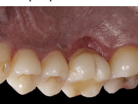
Fig. 9 – Controlo após 45 dias da AR