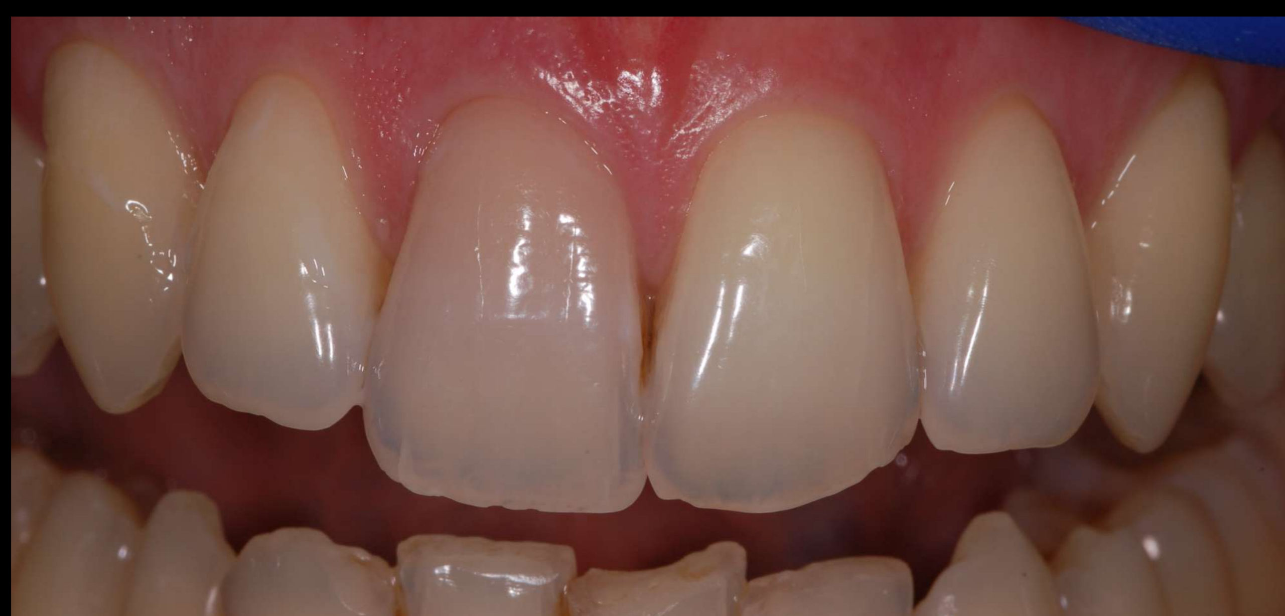
Imagem 4 – Fotografia intra-oral inicial.