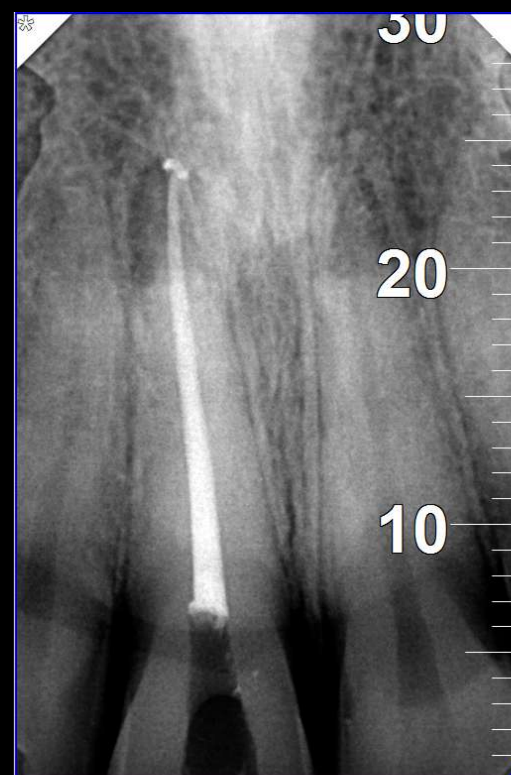
Imagem 3 – Radiografia final.