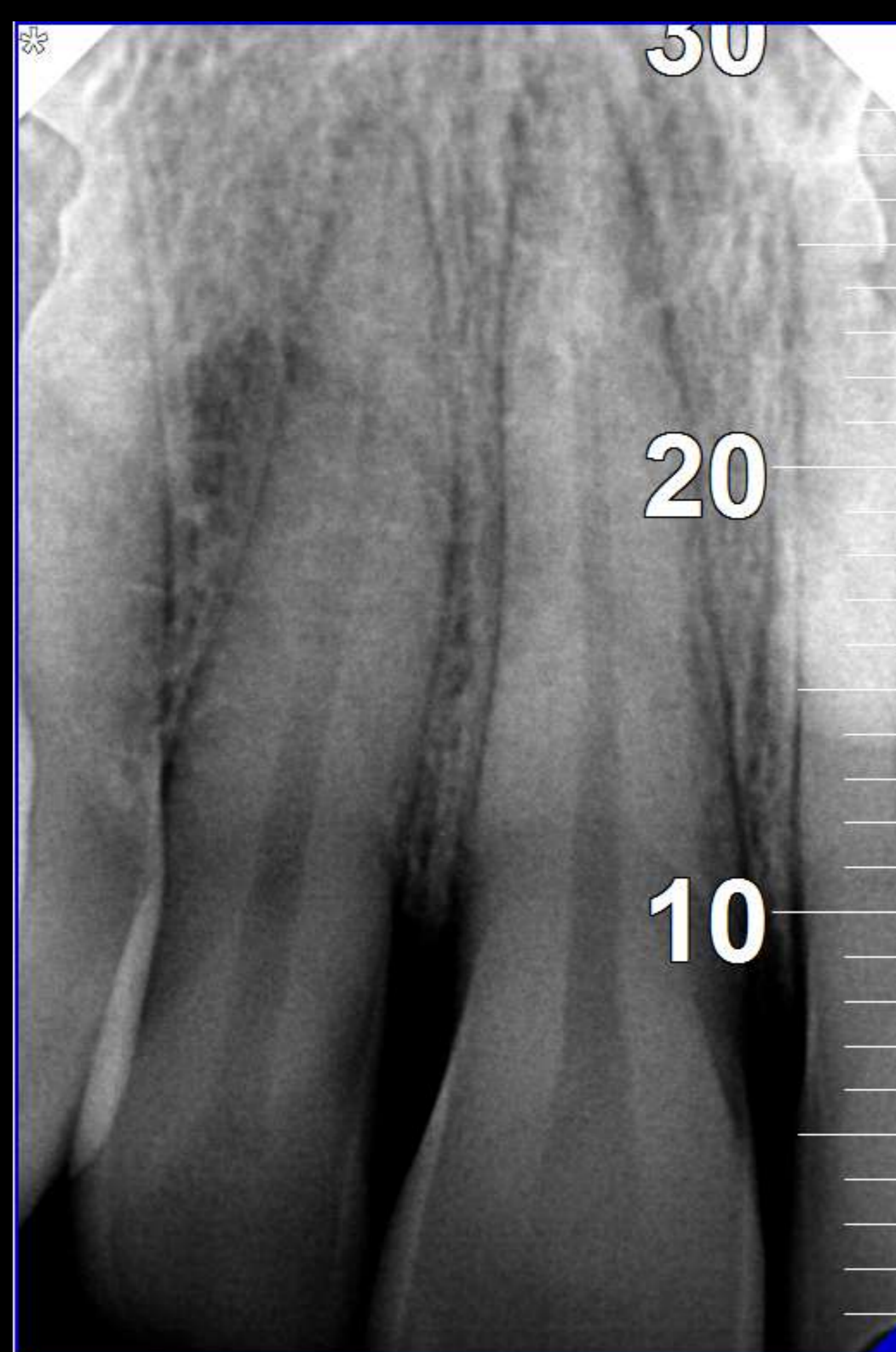
Imagem 1 – Radiografia inicial.

Plano de Tratamento: pulpectomia e obturação canalar do 11 e sessões de branqueamento interno.