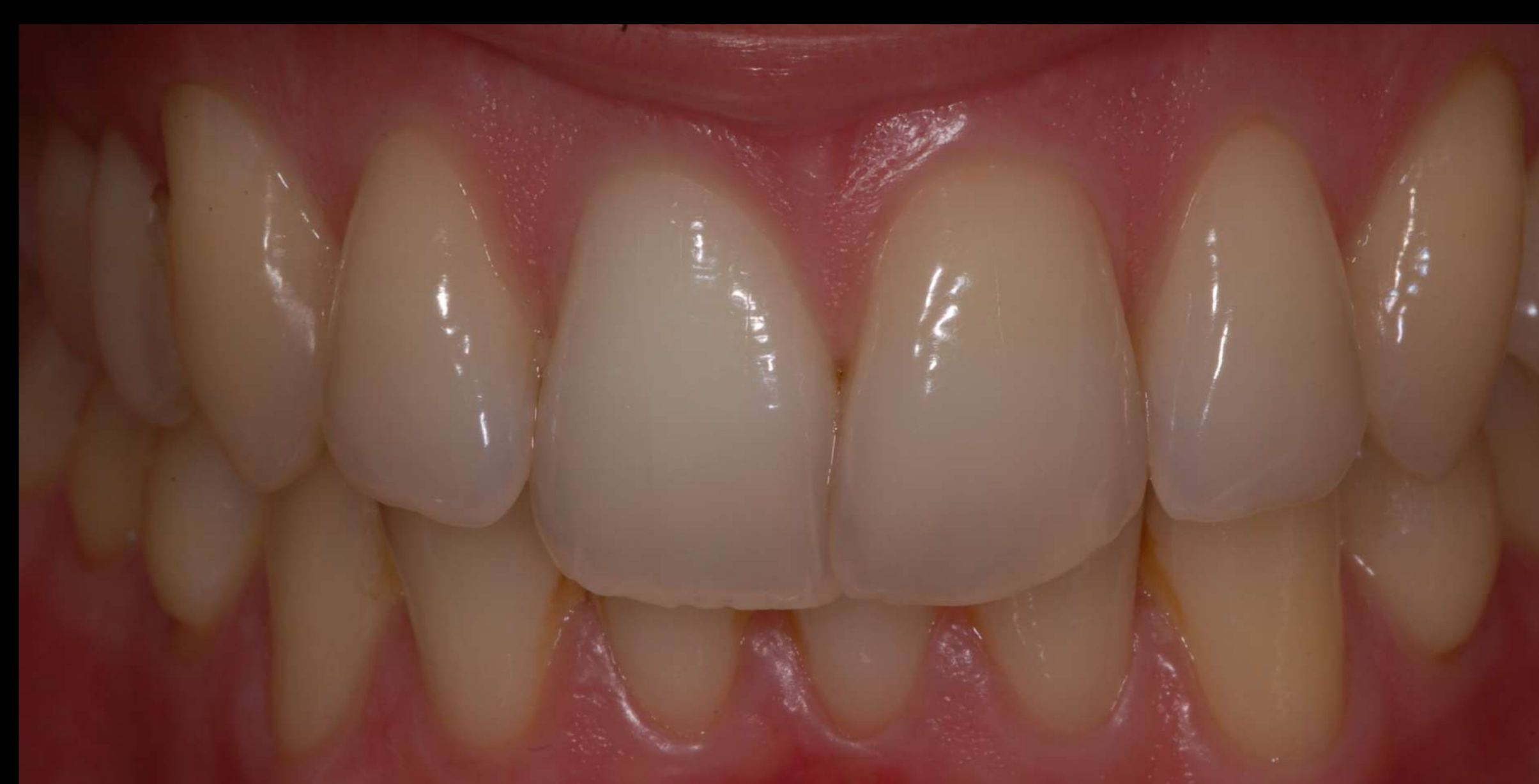
Imagem 5 – Fotografia intra-oral final após sessão de branqueamento interno.