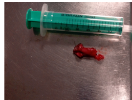
FIG.4 – vista macroscópica da peça