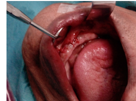
FIG.8 – aspecto intra-oral da ferida operatória