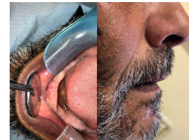
FIG.9 – controlo aos 2 meses (completa cicatrização dos tecidos)