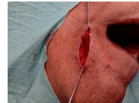
FIG.6 – sutura por planos (pormenor da sutura intradérmica)