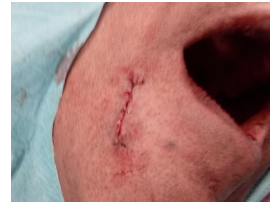
FIG.7 – encerramento sem tensão dos bordos