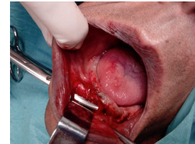
FIG.3 – disseção/individualização do trajecto fistuloso (vista B)