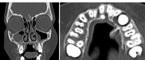
Fig.4: Projeção da apófise alveolar esquerda.