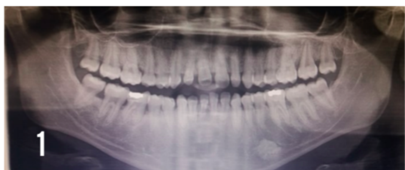
Figura 1 - Ortopantomografia