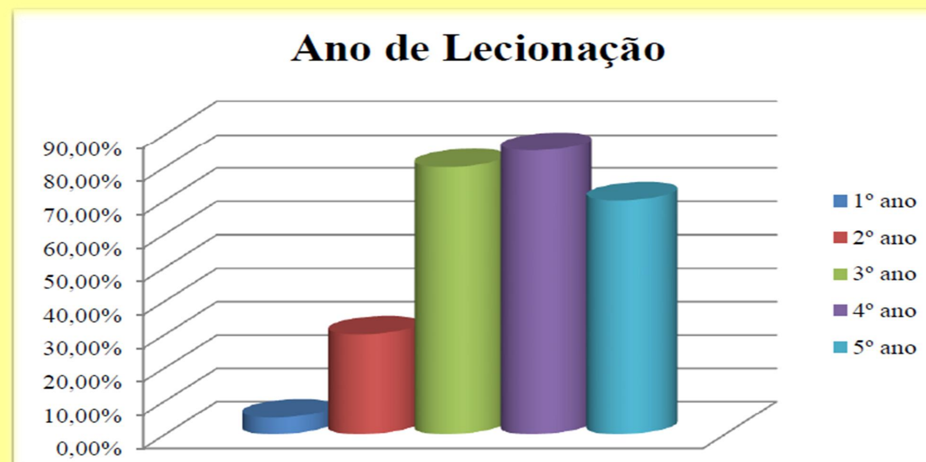
Gráfico 2- Ano curricular em que a cirurgia e medicina oral são lecionadas.

- não seguem a recomendação da Association for Dental Education in Europe (ADEE) para atribuir uma importância maior às competências de medicina oral, atribuindo um valor de ECTS superior à UC de cirurgia oral;