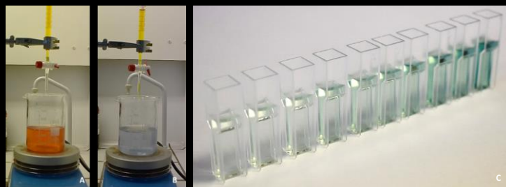
Figura 1 – Titulação com sulfato de cério (IV) 0,1M antes (A) e depois (B) do ponto de equivalência e exemplo de soluções da reta de calibração para a técnica de ABTS, com dez pontos (C).

Foram analisados 3 lotes de cada produto (White Dental Beauty ® , West Yorkshire, UK) distribuído nos seguintes grupos: Grupo 1 – 6% PH, Grupo 2 – 16% PC, Grupo 3 – 10% PC, Grupo 4 – 5% PC. Foram realizadas titulações para determinação da concentração de PH através do Sulfato de Cério IV (Figura 1A e 1B). A cinética de libertação de PH foi avaliada por uma técnica espectrofotométrica com indicador colorimétrico de sal diamónia do ácido 2,2'-Azino-bis(3-etilbenzotiazolina-6-sulfónico) (ABTS), previamente descrita (5) e foram elaboradas retas de calibração do espectrofotómetro (M501 single beam, CAMSPEC, Reino Unido) com 10 pontos (Figura 1C). Para cada lote de cada produto foram analisadas 10 amostras de gel (n=30 por grupo), em diferentes períodos pré-determinados (0, 1, 2, 3, 4, 5, 10, 15, 20, 30, 40, 60, 90, 120, 150, 180 e 240 minutos, de acordo com o tempo de aplicação recomendado pelo fabricante). Os resultados da titulação encontram-se expressos em média e intervalo de confiança (IC) 95% da percentagem de PH titulada (w/w). A percentagem de PH libertada encontra-se expressa em média e IC 95%, considerando-se 100%, o valor médio das titulações iniciais. Os testes one sample t-test , one-way ANOVA , Tukey post hoc e correlação de Pearson foram utilizados conforme apropriado, e foi estabelecido um nível de significância de \alpha=0,05 .