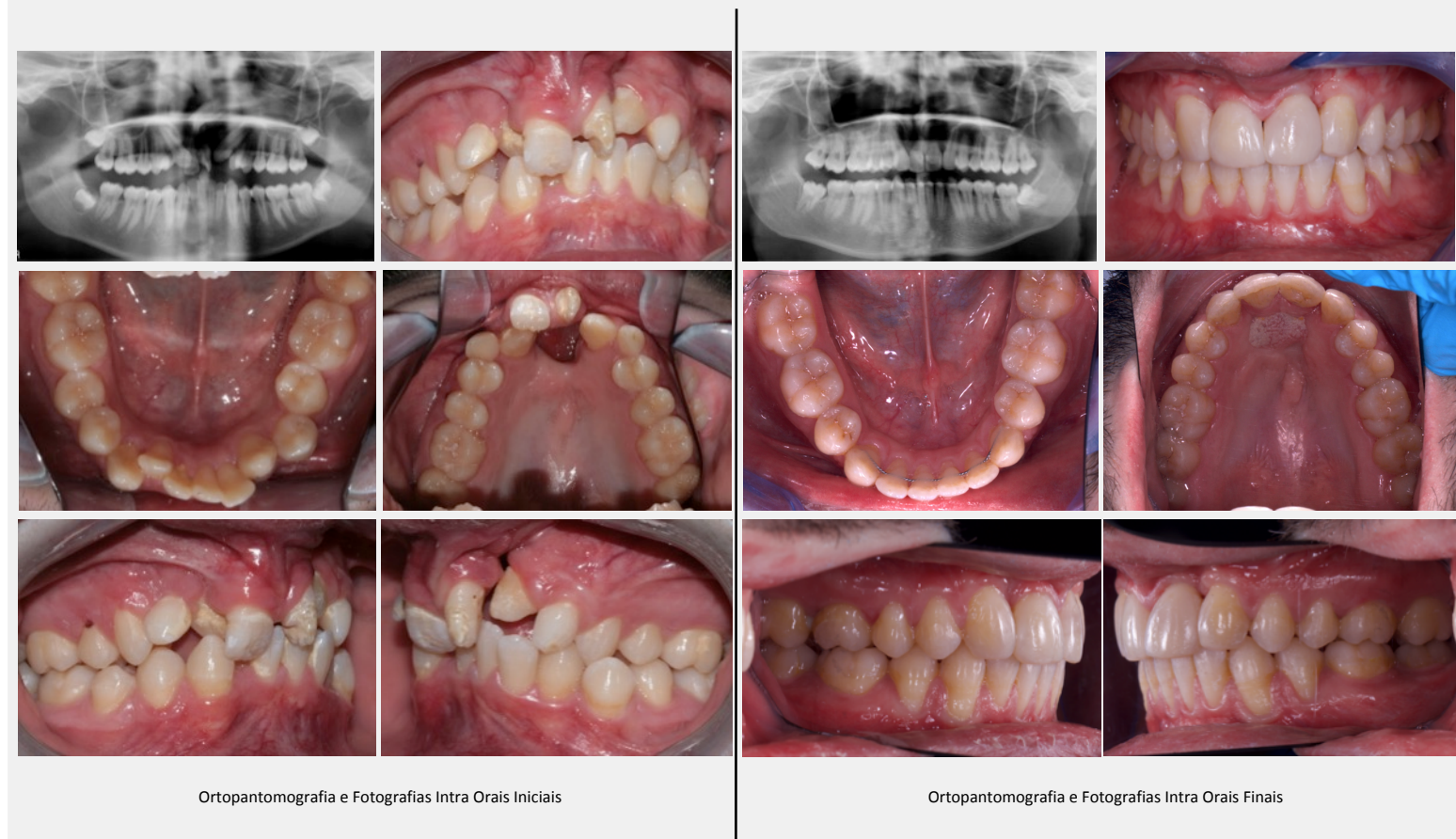
Ortopantomografia e Fotografias Intra Oraís Iniciais