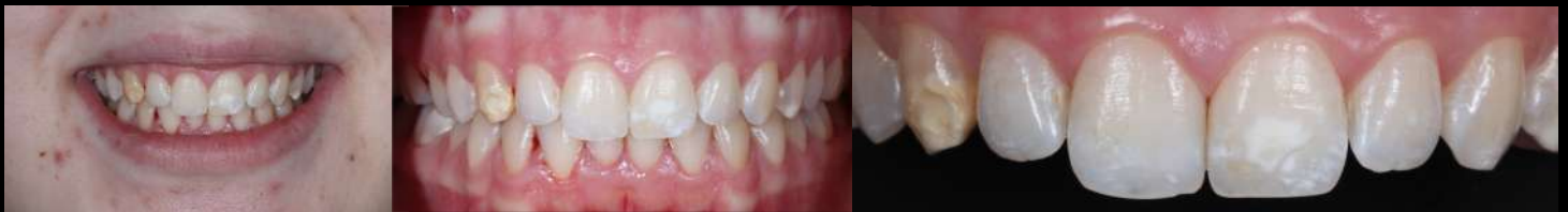
Fig. 1-3: Situação inicial de sorriso, intra-oral em intercuspidação máxima e close-up do maxilar superior.

Além da observação clínica da alteração de cor e tamanho das manchas visualmente detetáveis, essas alterações foram avaliadas com recurso ao Spectroshade Micro® em escala VITA Classical® e em valores de Lab* na cor global do dente e nas zonas das lesões brancas.