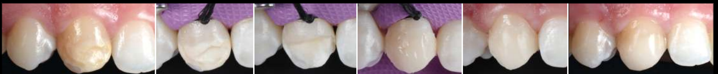
Fig. 7-12: Realização da restauração do dente 13 e resultado imediatamente após o polimento.