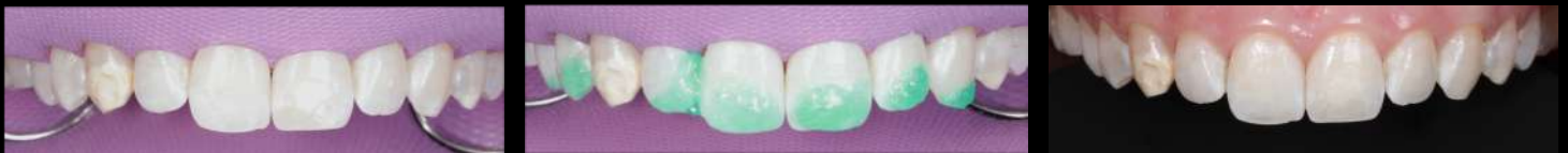
Fig. 4-6: Realização de infiltração da resina infiltrativa (ICON) e resultado imediatamente após a aplicação.