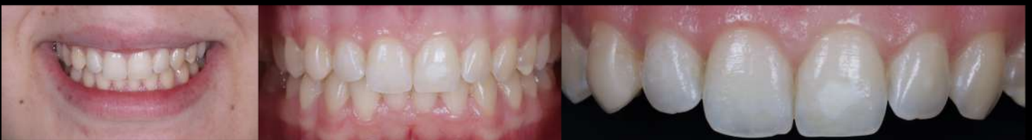
Fig. 14-16: Situação final de sorriso, intra-oral em intercuspidação máxima e close-up do maxilar superior.