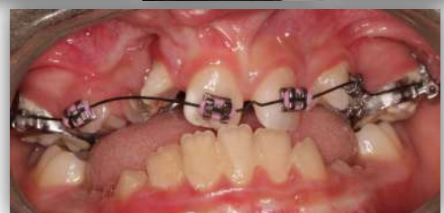
Figuras 10,11,12 e 13– Registos clínicos pós-tratamento