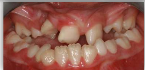
Figura 2, 3,4 e 5 – Registos clínicos pré-tratamento