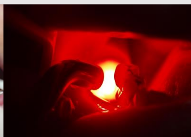
Imagem 6: Fotobiomodulação com laser de diodo 635nm