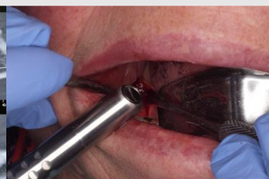
Imagem 4: Vaporização com laser Er: YAG

Imagem 1: Ao exame clínico foi verificada a zona do 4º Quadrante com edema, eritema, uma fístula com drenagem e locais com exposição de osso necrótico;