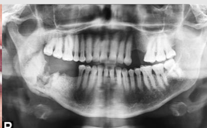
Imagem 2: Ortopantomografia inicial