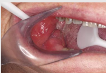
Imagem 1: Observação clínica inicial