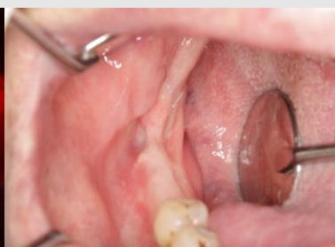
Imagem 7: Observação clínica final após 24 meses