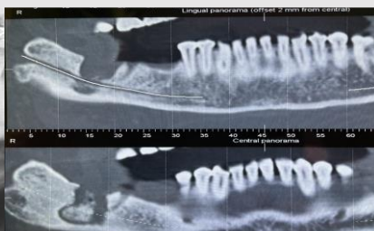
Imagem 3: Sequestros ósseos visíveis na TAC