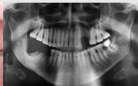
Imagem 8: Ortopantomografia final após 24 meses

Imagem 6: 4 meses após fotobiomodulação com laser Nd: YAG foi iniciada a terapia fotodinâmica com laser de diodo 635nm, durante 6 semanas;