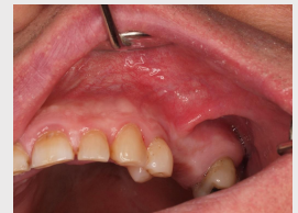
Fig. 5 – Reavaliação aos 6 meses

DISCUSSÃO: A fotocoagulação de hemangiomas da região oral e perioral com LASER Nd:YAG é um tratamento seguro, rápido e com poucas complicações. O baixo risco de hemorragia permite que a técnica seja aplicada em clínicas não equipadas para cirurgia e oferece importantes vantagens para o operador e paciente. A principal indicação são as lesões que causem desconforto estético ou funcional, nas quais é clara a natureza benigna da lesão.