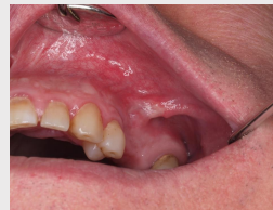
Fig. 4 – Reavaliação às 3 semanas