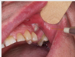
Fig. 3 – Tratamento com LASER Nd:YAG