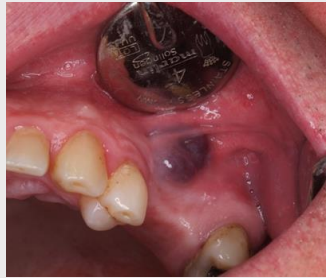
Fig. 1 – Lesão vascular na apresentação inicial