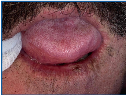
Fig. 1 – Lesões crostosas observadas no lábio inferior