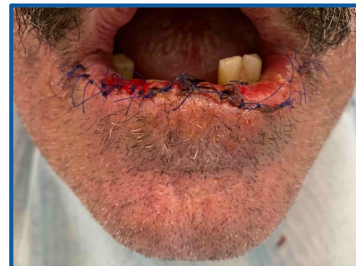
Fig. 3 – Avaliação pós-operatória ao 7º dia