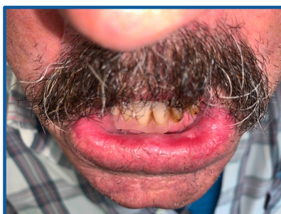
Fig. 4 – Avaliação pós-operatória ao 30º dia