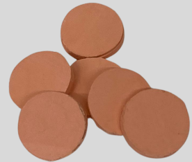
Fig 1. Amostras de guta-percha