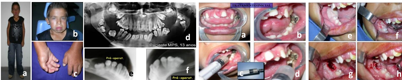
Fig.1. Portador de mucopolissacaridose tipo I, 13 anos. Observar o nanismo (a), assimetrias faciais (b) e dedos em arco (c). Radiografia panorâmica (d). Radiografia oclusal total de mandíbula direita e esquerda (e, f).