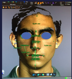
Imagens 1 e 2 - Exemplo de medições efectuadas nas Fotografias e Imagens 3D