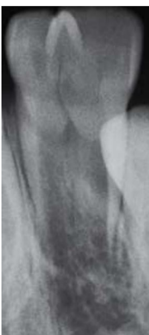
Figura 4: Radiografia periapical