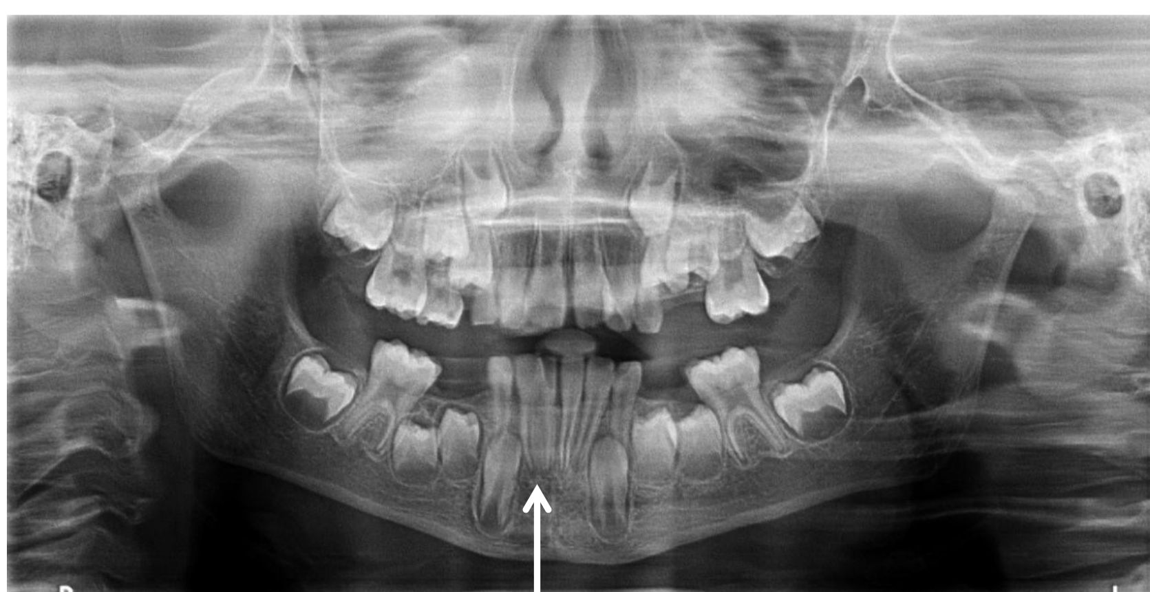
Figura 3: Ortopantomografia - identificando dente duplo