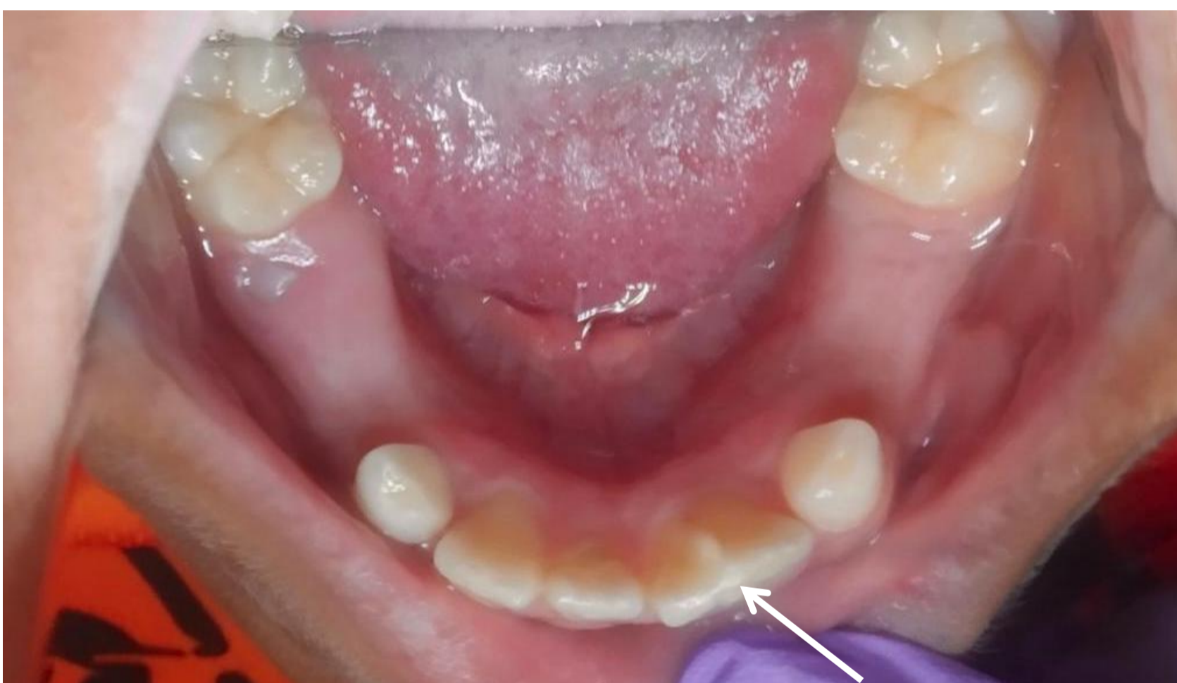
Figura 2: Cúspide em garra