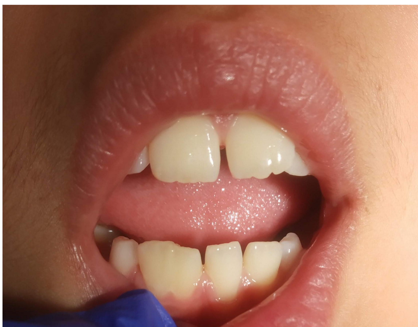
Figura 1: Dente duplo - superfície vestibular

Plano: Restauração dos dentes com cáries após abertura da lesão cariogénica e remoção do tecido cariado. Em relação ao dente fundido, decidido tratamento conservador/expectante.