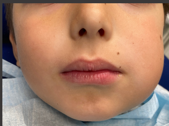
Fig. 1 – Edema do terço inferior da hemiface esquerda