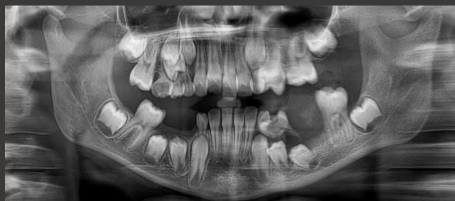
Fig. 3 – Ortopantomografia realizada no serviço de urgência do CHULN

Sob anestesia local procedeu-se a realização de biópsia incisional de lesão com punch e extração de 74 Exame histopatológico - granuloma periférico de células gigantes