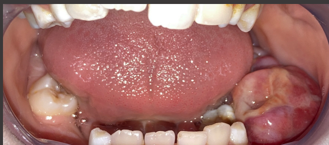
Fig. 2 – Lesão exofítica objectivada ao exame intra-oral