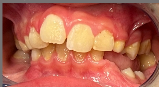
Fig. 6 – Exame intra-oral aos 2 meses pós-operatório