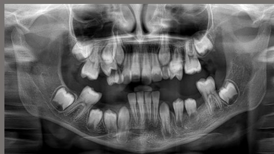
Fig. 7 – Ortopantomografia realizada aos 3 meses pós-operatório

Conclusão: Este caso demonstra um crescimento rápido de uma lesão intraoral, sendo a rápida realização de biópsia fundamental para o diagnóstico definitivo e definição de abordagem terapêutica adequada.