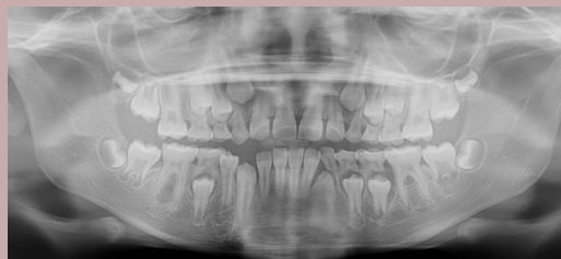
Fig. 5 – Ortopantomografia de reavaliação aos 3 meses

Discussão/conclusões: O caso descrito revela uma situação de osteomielite mandibular não odontogénica, cuja anamnese, exame objetivo e avaliação imagiológica da doente se revelaram essenciais para o diagnóstico definitivo. Nos doentes com anemia falciforme, a osteomielite mandibular é uma complicação rara que se poderá desenvolver em contexto de crise vaso-oclusiva. O presente caso permite alertar para a possibilidade de desenvolvimento desta situação clínica, contribuindo para um diagnóstico correto e tratamento dirigido.