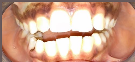
Fig. 2 – Vestíbulo do 4º quadrante livre ao exame intra-oral

alteração do trabeculado ósseo entre as raízes do dente 46 sugestivas de osteomielite crónica