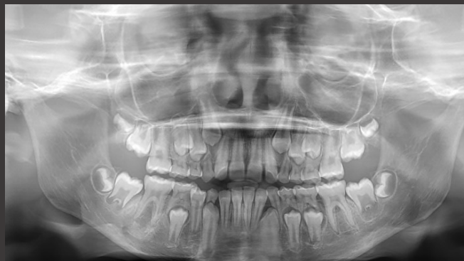
Fig. 4 – Ortopantomografia realizada no serviço de urgência do CHULN

Realizou-se colheita de exsudado purulento