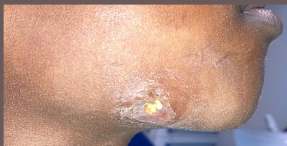
Fig. 1 - fístula cutânea com drenagem purulenta