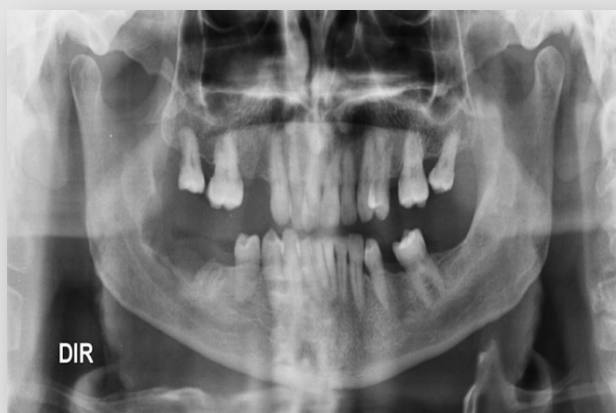
Fig. 2. Lesão osteolítica do 4º quadrante, de contornos irregulares, em OPG realizada na primeira observação em consulta.